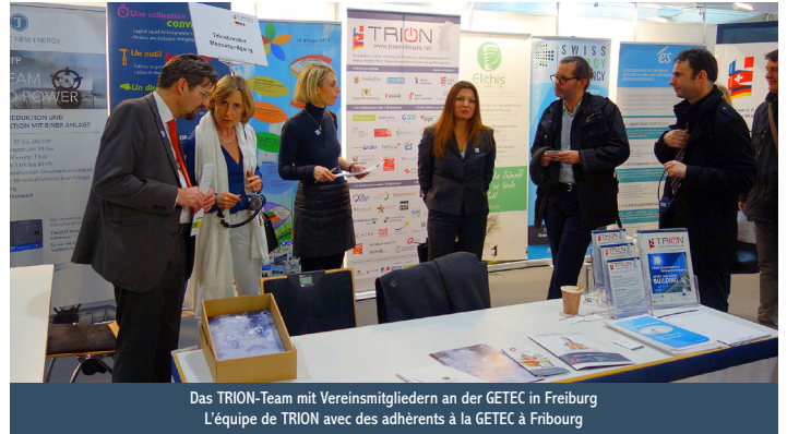
Das TRION-Team mit Vereinsmitgliedern an der GETEC in Freiburg L'équipe de TRION avec des adhérents à la GETEC à Fribourg

Un pas de plus vers un marché international ! De nombreux salons spécialisés dans les bâtiments performants, la production de biogaz, d'énergie éolienne ou de géothermie sont organisés dans le Rhin supérieur. TRION-climate est un partenaire de longue date de ces salons et les soutient dans leur orientation internationale. Les membres de l'association ont un accès privilégié à ces salons et peuvent se présenter en tant que sous-exposant sur le stand de TRION afin de promouvoir leur produits et services également dans un contexte international.