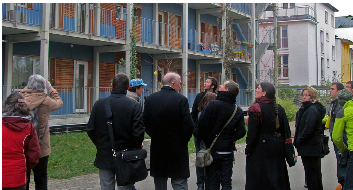
Besichtigung des nachhaltigen Stadtviertels Vauban in Freiburg, Veranstaltungsreihe Green visits Visite du quartier durable de Vauban à Fribourg, événement dans le cadre des « visites vertes »

Die Energiewende hautnah erleben! TRION-climate e.V. organisiert grenzüberschreitende Besichtigungen von vorbildhaften Vorhaben zur Umsetzung der Energiewende. Das sind z.B. nachhaltig gestaltete Stadtviertel, Anlagen zur erneuerbaren Energieproduktion oder besonders energieeffiziente Gebäude und Unternehmen. Diese Besichtigungen finden in kleinen Gruppen statt, und sind vorwiegend den Vereinsmitgliedern vorbehalten.