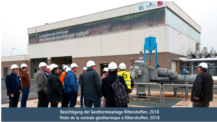
Besichtigung der Geothermieanlage Rittershoffen, 2018 Visite de la centrale géothermique à Rittershoffen, 2018