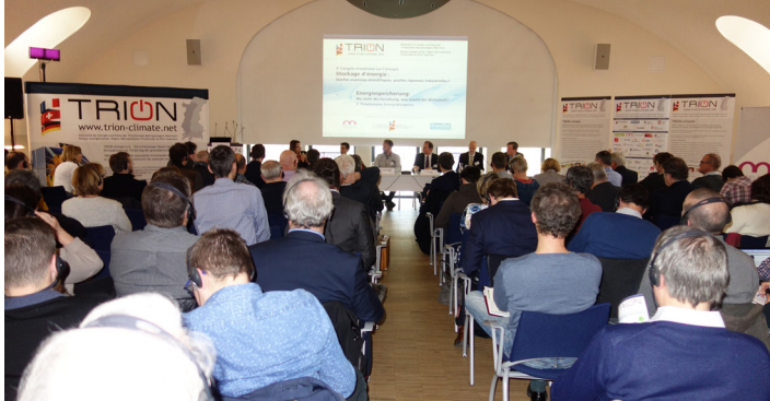
Trinationaler Energiekongress „Energiespeicherung“ am 23. November 2017 in Mulhouse 3 ème Congrès trinational sur le thème « Stockage d'énergie » le 23 novembre 2017 à Mulhouse

Grenzüberschreitende Zusammenarbeit beginnt mit Menschen! Das Ziel von TRION-climate e.V. ist es, die Energie- und Klimaakteure aus Politik, Verwaltungen, Wirtschaft und Zivilgesellschaft dies- und jenseits der Grenzen zu vernetzen, um sich kennenzulernen, interkulturelle Hemmnisse abzubauen und vertrauensvolle Beziehungen zu knüpfen. Sie schaffen so eine Grundlage für gemeinsame grenzüberschreitende Projekte.