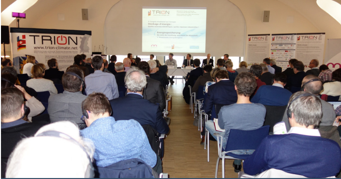
3. Trinationaler Energiekongress „Energiespeicherung“ am 23. November 2017 in Mulhouse 3 ème Congrès trinational sur le thème « Stockage d'énergie » le 23 novembre 2017 à Mulhouse

Grenzüberschreitende Zusammenarbeit beginnt mit Menschen! Das Ziel von TRION-climate e.V. ist es, die Energie- und Klimaakteure aus Politik, Verwaltung und Wirtschaft dies- und jenseits der Grenzen zu vernetzen, um sich kennenzulernen, interkulturelle Hemmnisse abzubauen und vertrauensvolle Beziehungen zu knüpfen. Sie schaffen so eine Grundlage für gemeinsame grenzüberschreitende Projekte.