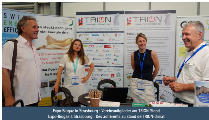
Expo Biogaz in Strasbourg : Vereinsmitglieder am TRION-Stand Expo-Biogaz à Strasbourg : Des adhérents au stand de TRION-climat

Un pas de plus vers un marché international ! De nombreux salons spécialisés dans les bâtiments performants, la production de biogaz, d'énergie éolienne ou de géothermie sont organisés dans le Rhin supérieur. TRION-climat est un partenaire de longue date de ces salons et les soutient dans leur orientation internationale. Les membres de l'association ont un accès privilégié à ces salons et peuvent se présenter en tant que sous-exposant sur le stand de TRION afin de promouvoir leurs produits et services dans un contexte international.