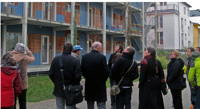
Besichtigung des nachhaltigen Stadtviertels Vauban in Freiburg, Veranstaltungsreihe Green visits Visite du quartier durable de Vauban à Fribourg, événement dans le cadre des « visites vertes »

Die Energiewende hautnah erleben! TRION-climate e.V. organisiert regelmäßig grenzüberschreitende Besichtigungen von vorbildhaften Vorhaben zur Umsetzung der Energiewende. Das sind z.B. nachhaltig gestaltete Stadtviertel, Anlagen zur erneuerbaren Energieproduktion oder besonders energieeffiziente Gebäude und Unternehmen. Diese Besichtigungen finden in kleinen Gruppen statt, und sind vorwiegend den Vereinsmitgliedern vorbehalten.