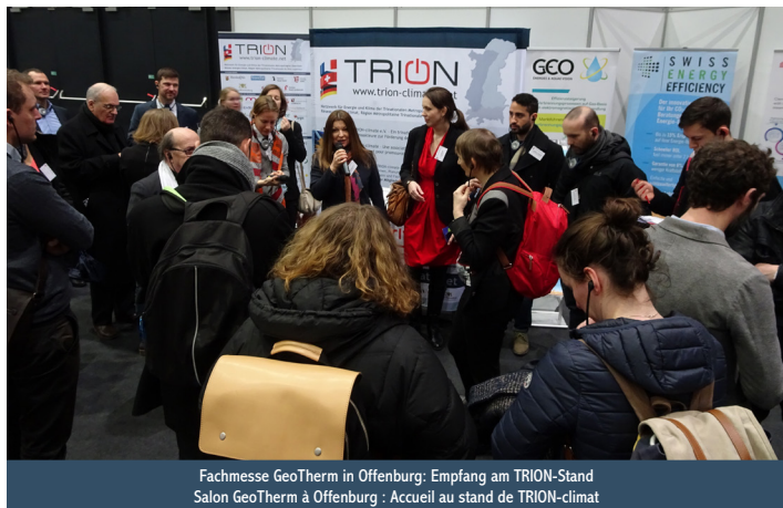
Fachmesse GeoTherm in Offenburg: Empfang am TRION-Stand Salon GeoTherm à Offenburg : Accueil au stand de TRION-climat